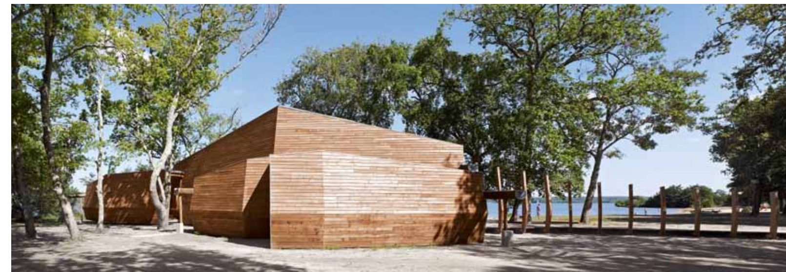
Incitatifs, les arcs ascendants de l'entrée concluent la promenade le long des plages du lac.

de garage des barques, le laboratoire d'analyse d'échantillons prélevés sur place et la salle de conférences s'organisent autour du hall d'accueil et d'exposition permanente. La seconde, plus modeste, est la Batellerie, un volume indépendant dédié à la détente et aux vestiaires des bateliers, plus un local pour le dépôt du matériel. En effet, depuis 1908, les trente-cinq guides-rameurs qui forment la Batellerie sont les seuls habilités à naviguer dans la zone (d'avril à septembre) pour la faire découvrir aux touristes. Pour s'adapter à cette activité, le projet devait s'implanter au bord du lac, sur la rive est, parmi les îlots de sable créés par les débouchés de ruisseaux. Conscient de la valeur du patrimoine forestier local, sinistré par la tempête Klaus, le Syndicat intercommunal d'aménagement et de gestion de la réserve (maître d'ouvrage) souhaitait également conserver les