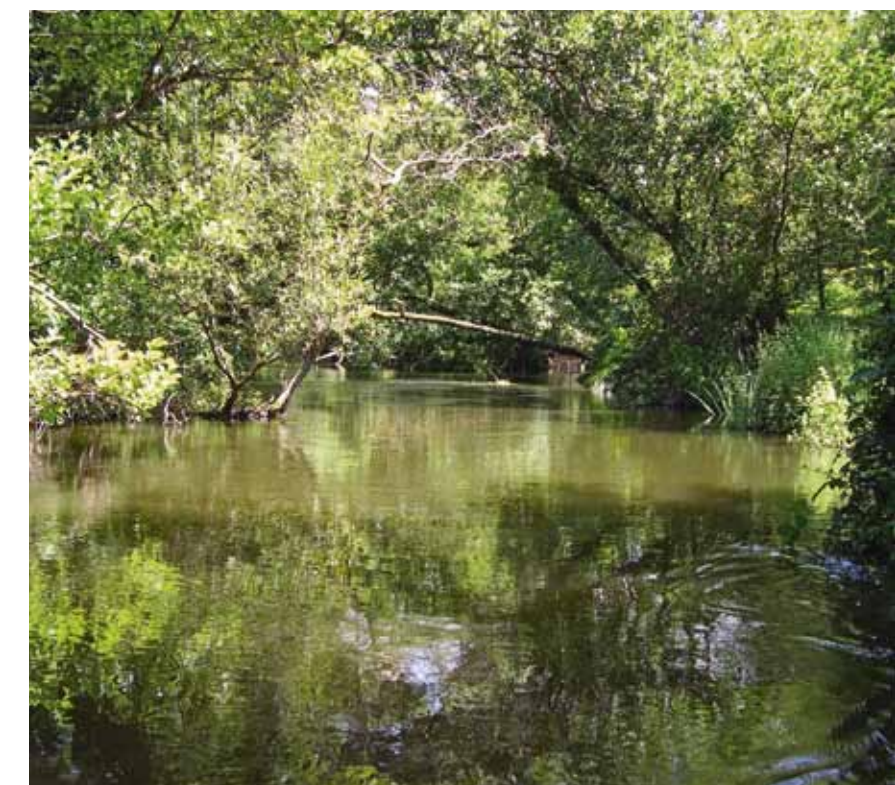
Les bateliers sont les seuls habilités à naviguer sur le courant d'Huchet.