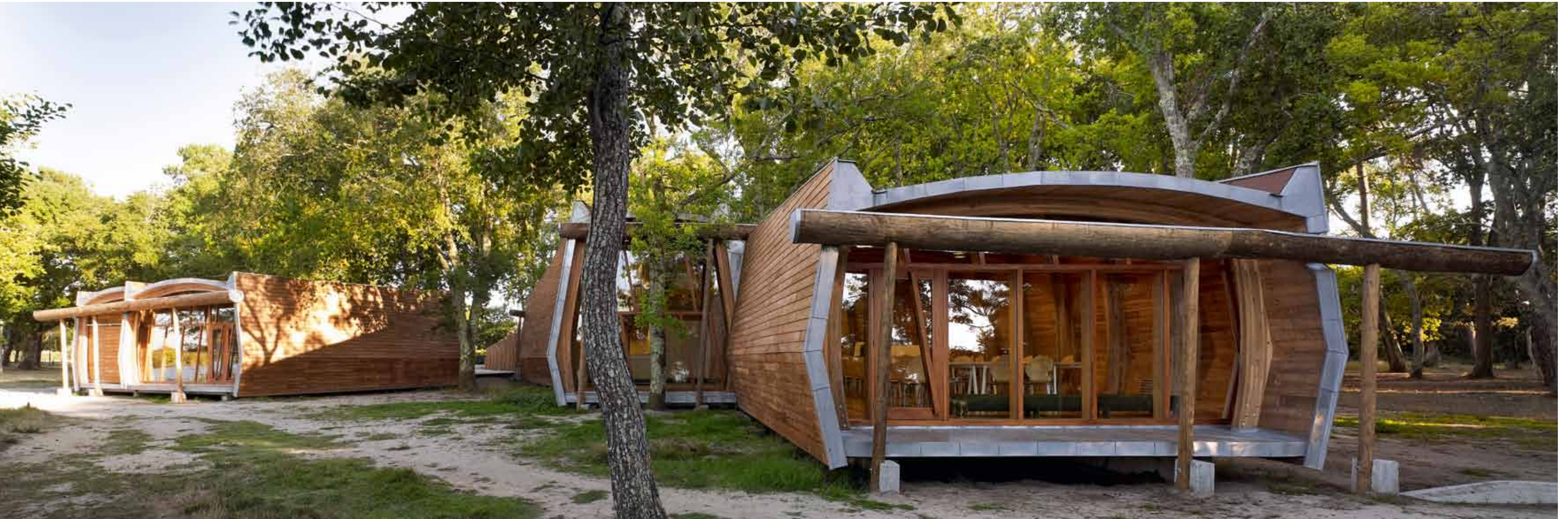
Les grandes surfaces vitrées offrent des vues généreuses sur le lac, sujet central du projet.

La réserve protège des systèmes dunaires à l'origine de la formation de marais et de plans d'eau littoraux. Le courant d'Huchet, qui sert d'exutoire direct à l'océan pour l'étang de Léon, se caractérise par la coexistence d'eau douce et d'eau saumâtre, de sols très secs et de terres inondées. Ces conditions particulières expliquent la diversité de ses milieux et son appellation de site naturel classé en 1934, puis de réserve naturelle en 1981. Rives marécageuses, rivière, tourbières, forêt de pins maritimes et dunes abritent une quarantaine d'habitats naturels et semi-naturels peuplés d'une flore et d'une faune très riches, à découvrir à pied ou en barque.