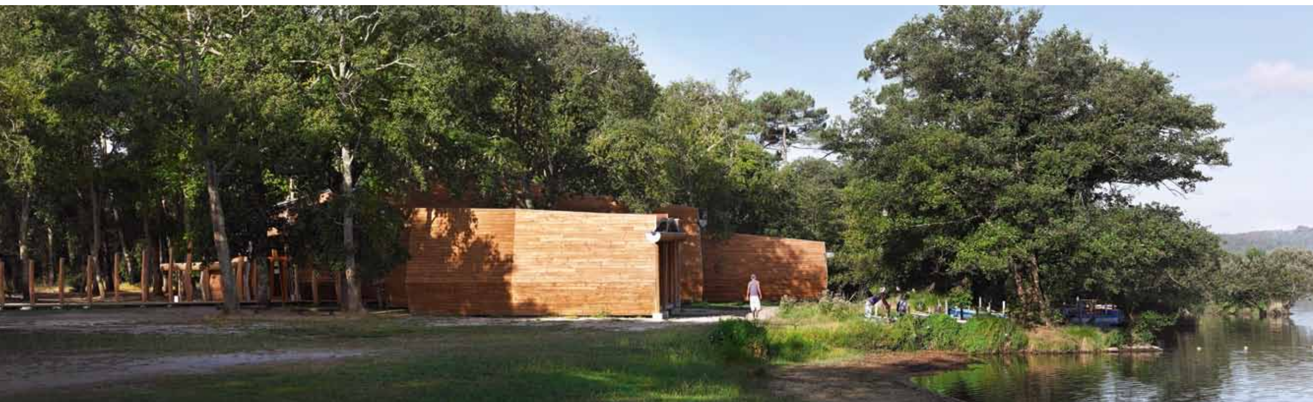
L'implantation dans le sous-bois de chênes, pins et aulnes, contribue à un rafraîchissement économe en été.