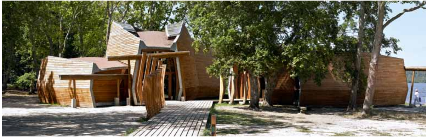
Les éclairages zénithaux viennent déstructurer l'espace par des jeux d'ombres et de variation lumineuse.