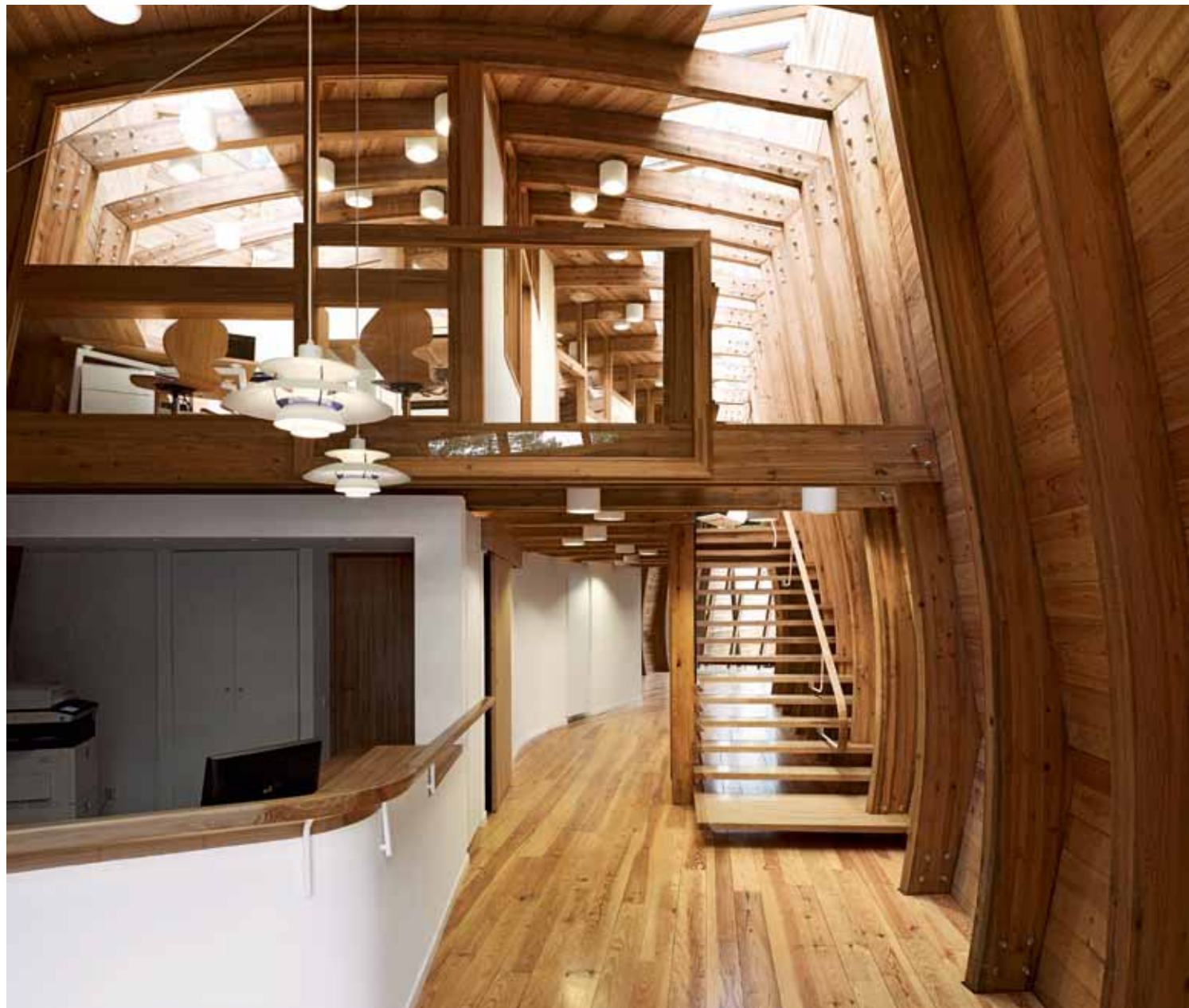
Le moilage des poutres contribue à la légèreté de la charpente tout en rappelant les fines sections de l'escalier. L'étage regroupe les bureaux tout en créant des espaces à double hauteur.