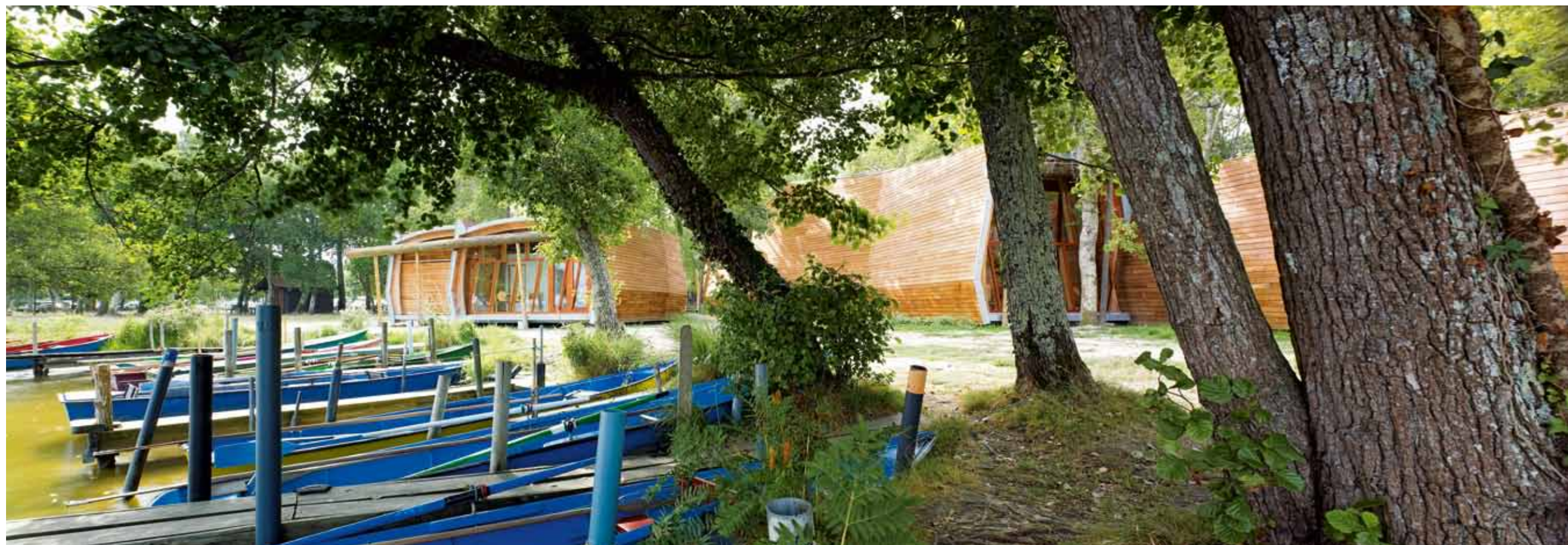
Avec son architecture organique et son plan disloqué, le projet évoque à la fois l'amarrage des barques et les méandres des ruisseaux.

Dans un souci de fluidité entre intérieur et extérieur, les concepteurs ont prévu un accès en pente très douce, encadré par une série d'arcs en bois dont la hauteur est ascendante. Ce jeu de pentes se retrouve dans les lignes d'égout et de faîtage ; autant d'écarts par rapport